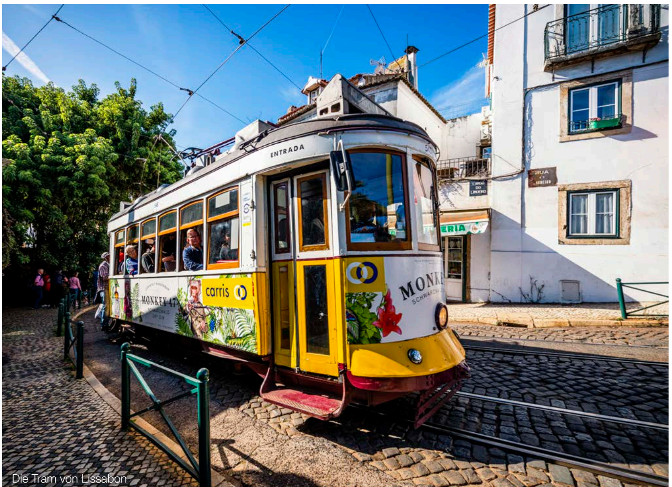
Die Tram von Lissabon

für die Freistellung ist allerdings, dass die Beteiligung zu Beginn des Kalenderjahres, in dem die Dividenden bezogen werden, mindestens 10% des Grund- oder Stammkapitals beträgt. Wird dieser Beteiligungsumfang nicht erreicht, werden die daraus bezogenen Ausschüttungen als sog. Streubesitzdividenden ohne Anwendung der Steuerbefreiung der laufenden Besteuerung unterzogen (§ 8b Abs. 4 Satz 1 KStG).