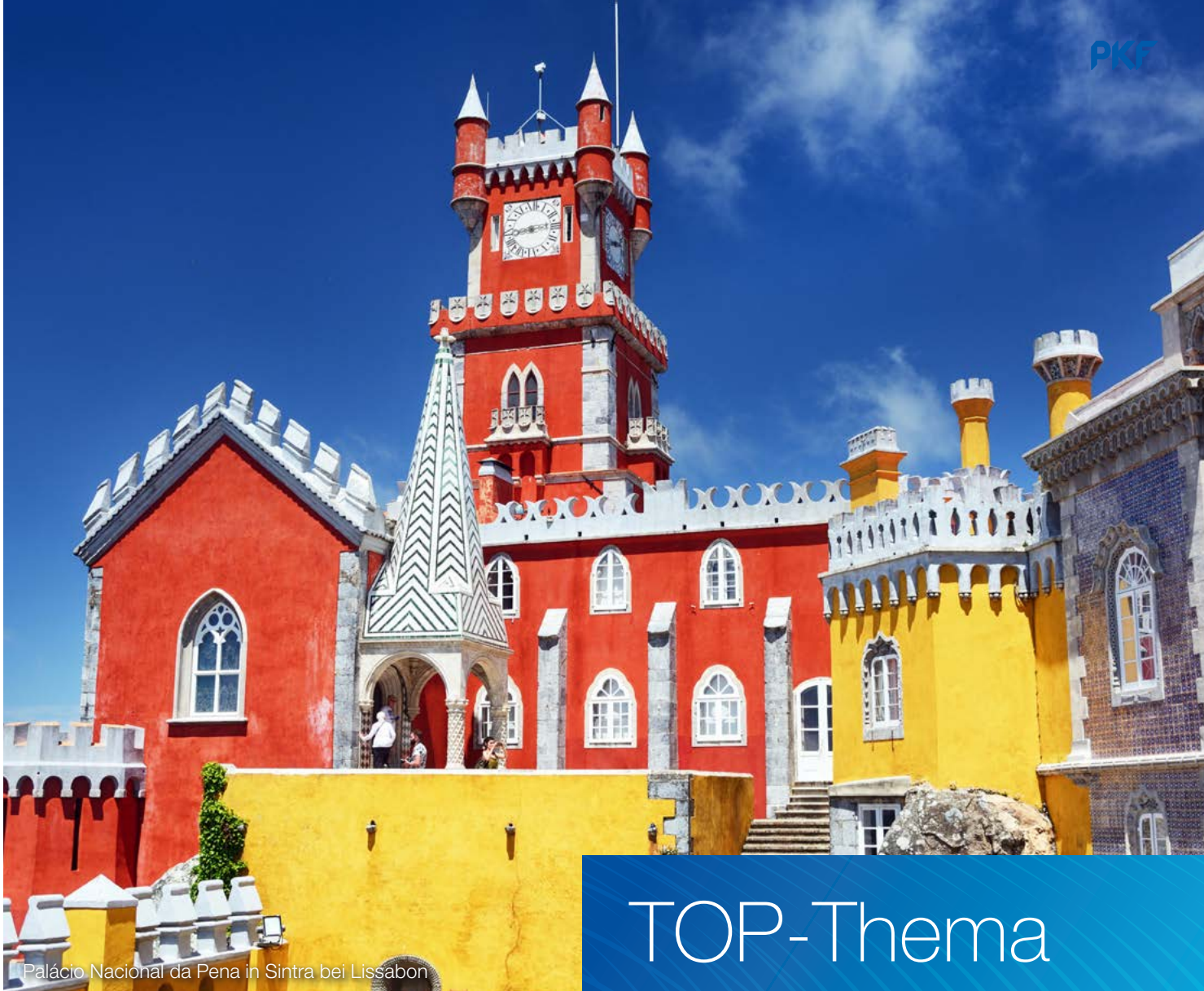
Palácio Nacional da Pena in Sintra bei Lissabon

Titelfoto: Porto mit der Dom-Luis-Brücke über den Douro