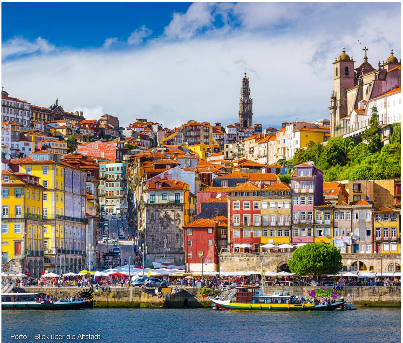
Porto – Blick über die Altstadt

Die zukünftige Entwicklung der geldpolitischen Beschlüsse einer Zentralbank ist nicht verlässlich vorherzusagen, da sie von einer Vielzahl von Einflussfaktoren