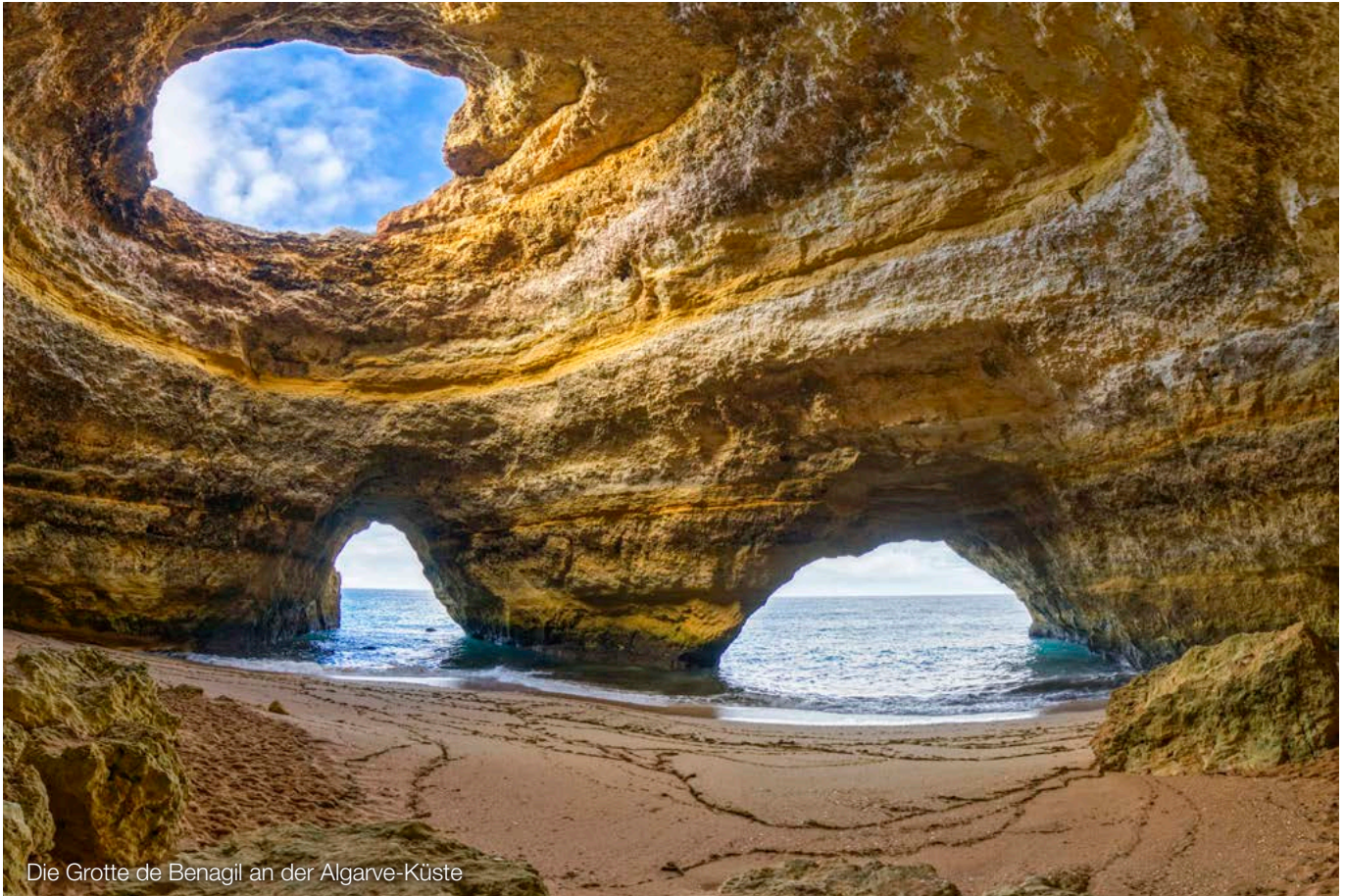
Die Grotte de Benagil an der Algarve-Küste

die Daten und ihre Zusammenhänge gewonnen. Datenvisualisierungstechniken werden eingesetzt, um Daten auf anschauliche Weise darzustellen und Muster, Trends und Beziehungen zu identifizieren.