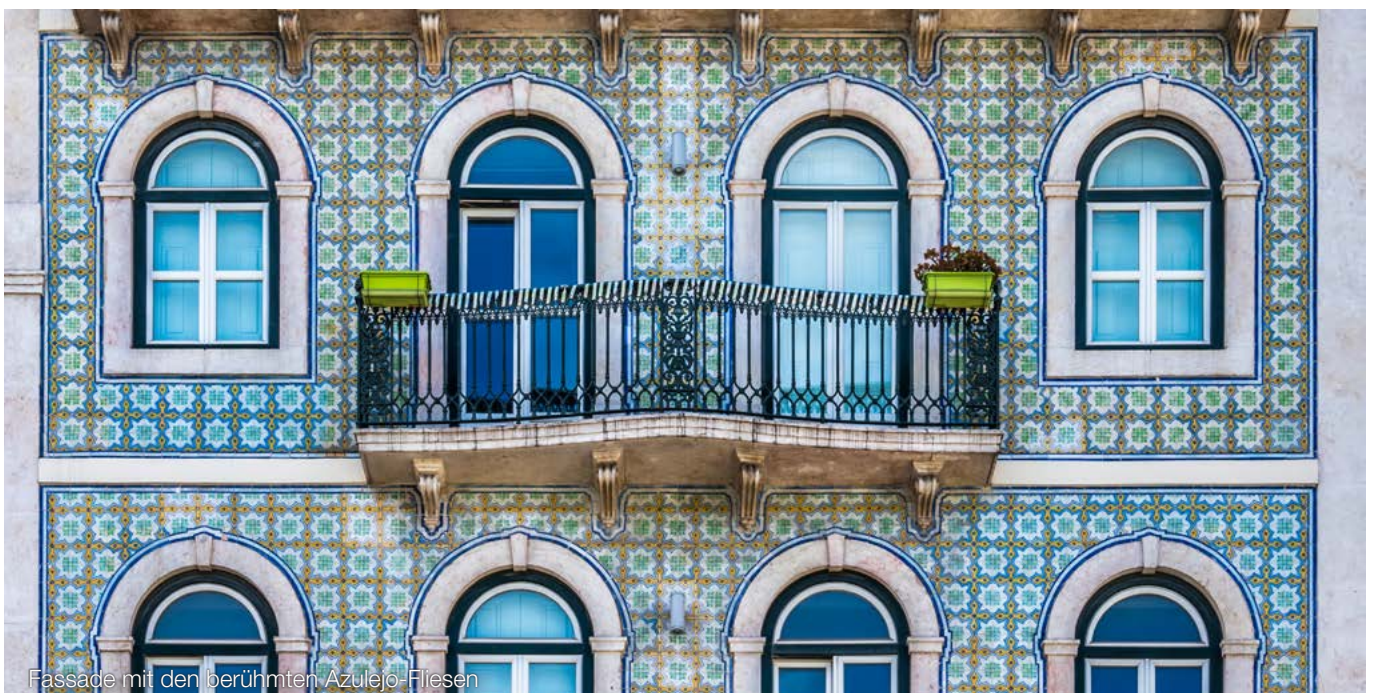
Fassade mit den berühmten Azulejo-Fliesen

So sah es auch der BFH: Die Münchener Richter weisen darauf hin, dass der Mann die Immobilie weder durchgängig noch im Jahr der Veräußerung und in den beiden Vorjahren selbst genutzt habe, da er bereits im Jahr 2015 ausgezogen sei. Zwar könne eine mittelbare Nutzung zu eigenen Wohnzwecken darin gesehen werden, dass der Mann seinem Sohn die Immobilie unentgeltlich zur Nutzung überlassen habe. Ausschlaggebend sei hier aber die Nutzung durch die geschiedene Ehefrau und diese könne nicht mehr als Eigennutzung des Ehemanns gesehen werden (sog. schädliche Mitbenutzung). Das Vorliegen eines privaten Veräußerungsgeschäfts hätte lediglich durch eine Zwangslage wie z.B. eine Enteignung oder eine Zwangsversteigerung ausgeschlossen werden können. Eine solche Zwangslage liege im entschiedenen Fall allerdings nicht vor. Zwar habe die geschiedene Ehefrau ihren Ex-Partner erheblich unter Druck gesetzt, letztlich habe dieser aber seinen Anteil an dem EFH freiwillig an seine geschiedene Frau veräußert.