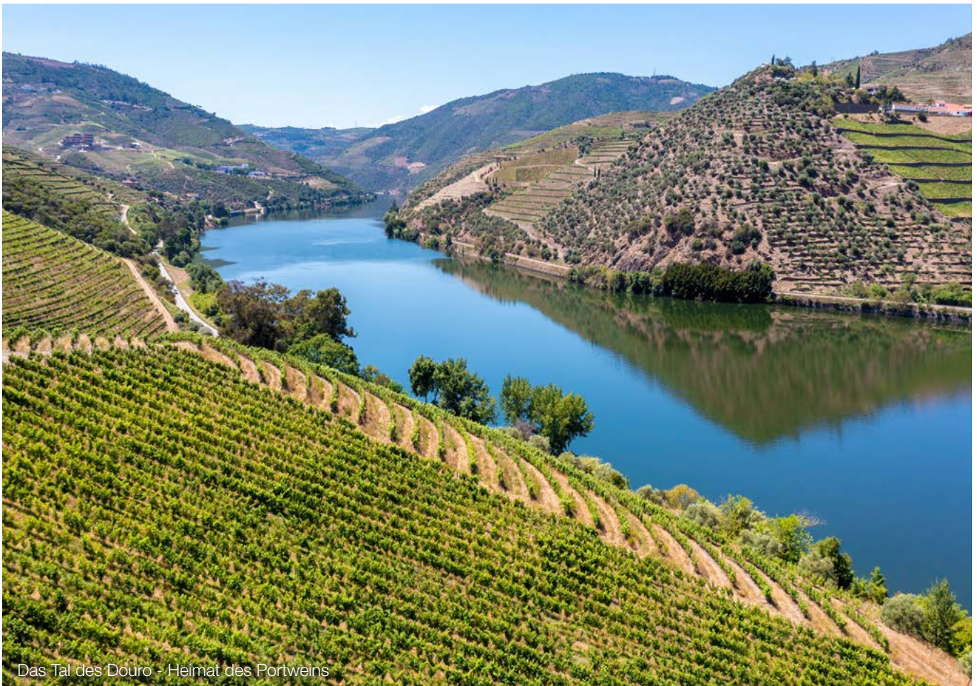
Das Tal des Douro - Heimat des Portweins

lungen entgegenwirken. Dabei genügt es zunächst, im Rahmen einer Aufbauprüfung jede identifizierte Kontrolle auf Angemessenheit zu prüfen.