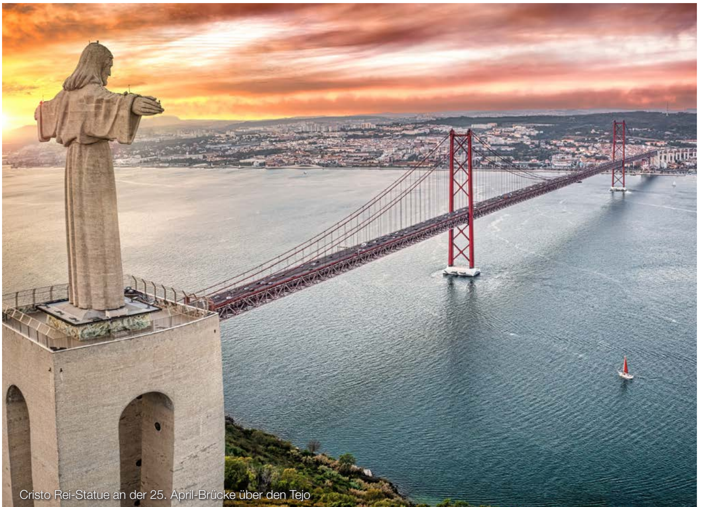
Cristo Rei-Statue an der 25. April-Brücke über den Tejo

Deutschland als Ansässigkeitsstaat vermeidet eine Doppelbesteuerung durch die Freistellung der Einkünfte unter Berücksichtigung des Progressionsvorbehalts (§ 32b EStG). Dies setzt allerdings voraus, dass die Einkünfte im ausländischen Staat besteuert werden. Nach einzelnen DBA wird anstelle der Freistellung die sog. Anrechnung (§ 34c EStG) durchgeführt (z.B. Dänemark, Frankreich, Italien, Norwegen).