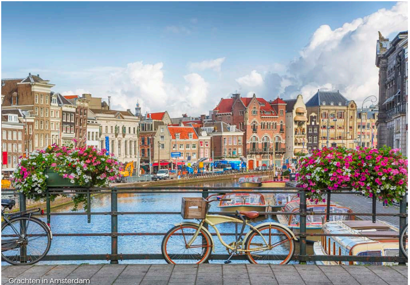
Grachten in Amsterdam

Das BMF hat dieses EuGH-Urteil mit Schreiben vom 27.2.2024 (Az.: III C 2 - S 7282/19/10001 :002) in die