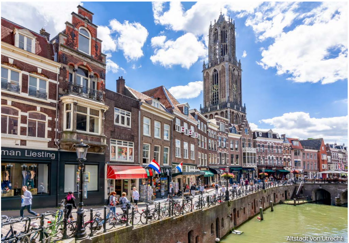
Altstadt von Utrecht

Die neu eingefügte Vorschrift sieht vor, dass Ausführer beim Verkauf, der Lieferung, der Verbringung oder der Ausfuhr bestimmter Güter und Technologien in Drittländer die Wiederausfuhr nach Russland oder