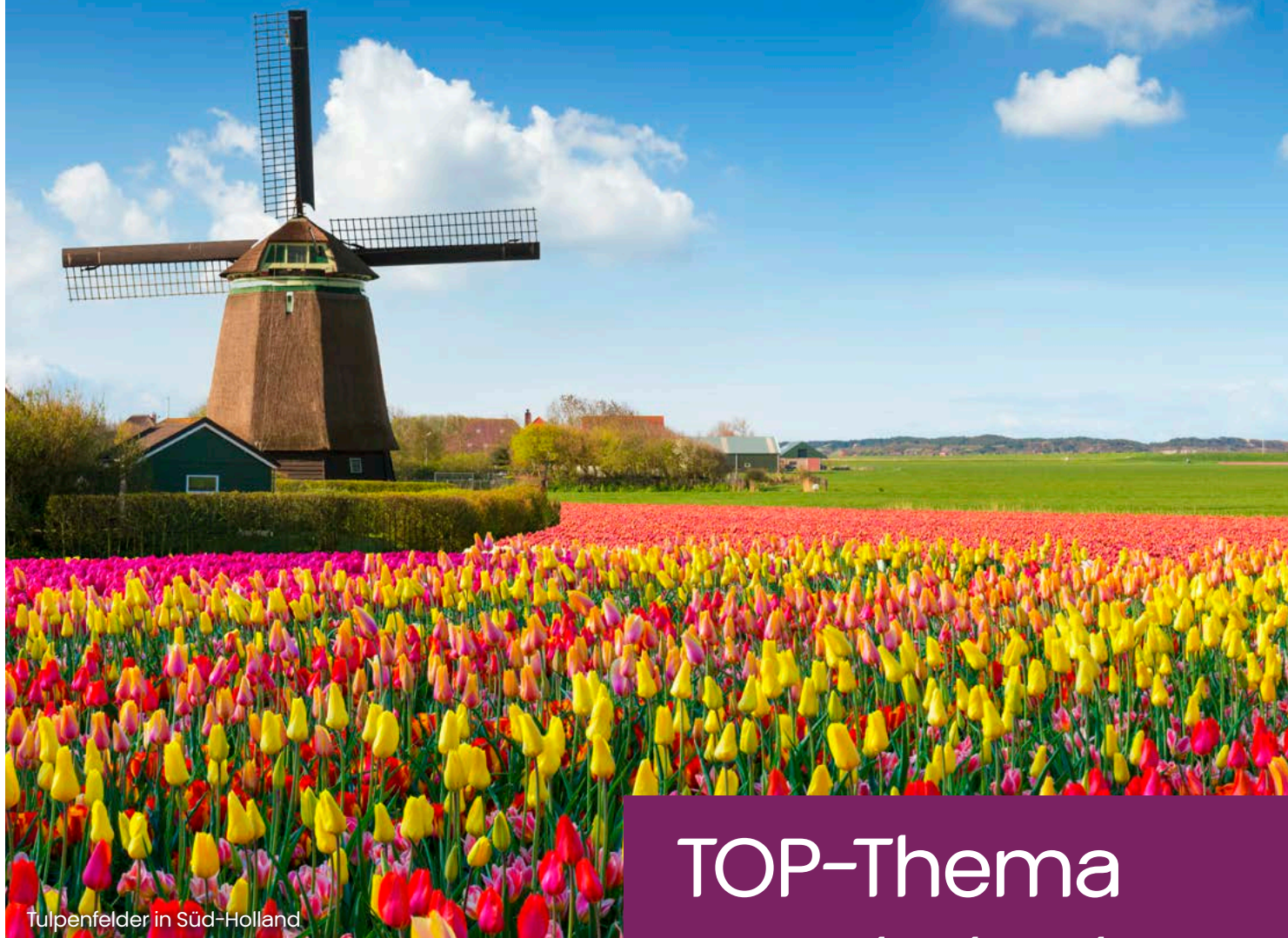
Tulpenfelder in Süd-Holland