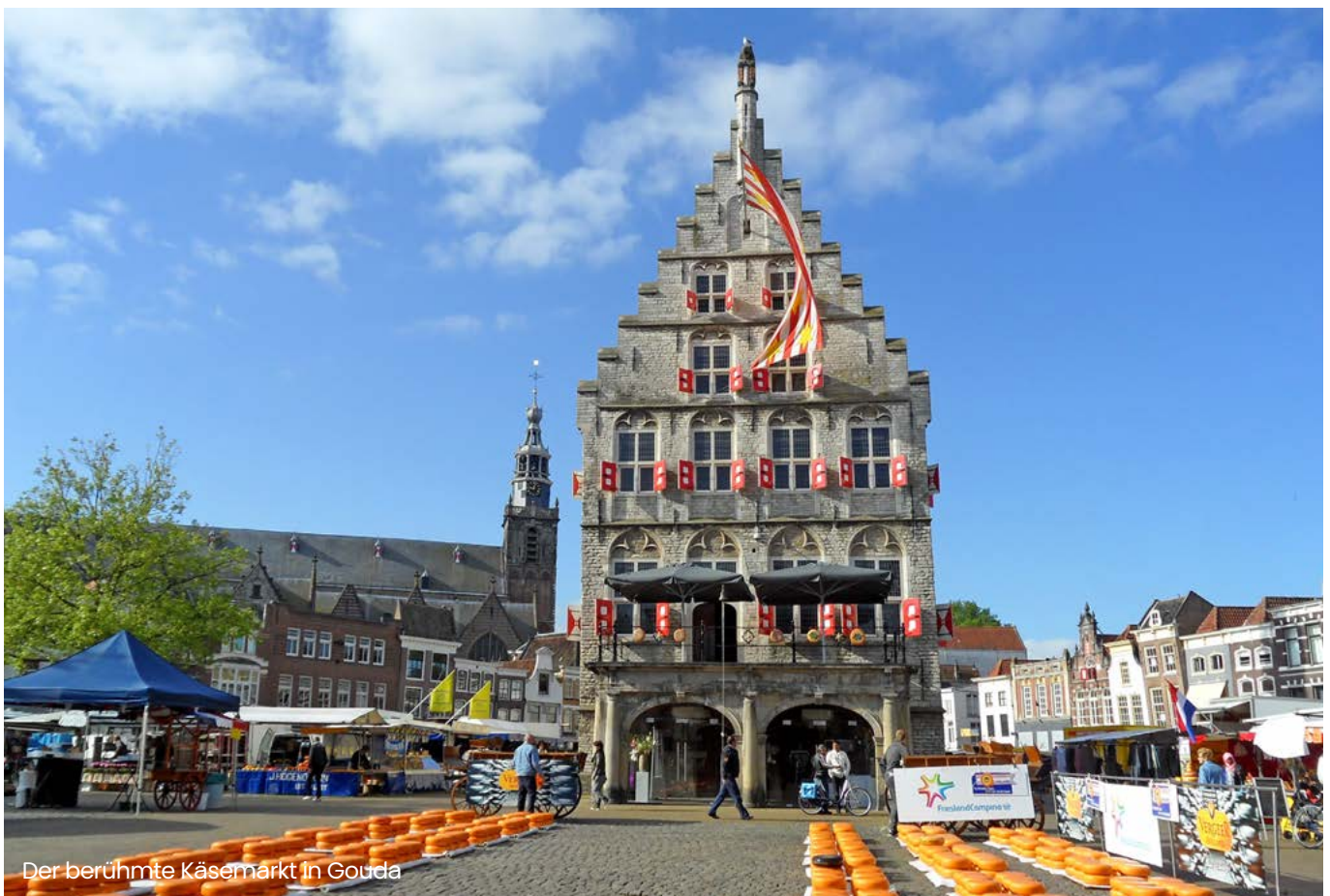
Der berühmte Käsemarkt in Gouda

Kurzfristige Überbrückungskredite sind vorübergehende Finanzierungsmaßnahmen und stellen keine