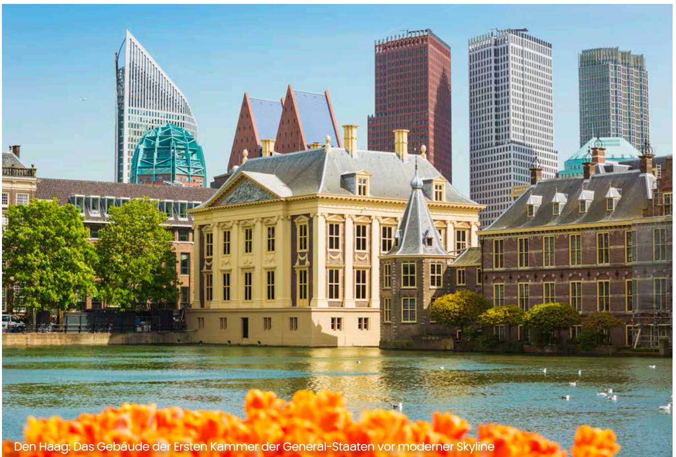
Den Haag: Das Gebäude der Ersten Kammer der General-Staaten vor moderner Skyline

Überbrückungsdarlehen spielen eine wichtige Rolle als Finanzierungsoption für Unternehmen, die sich