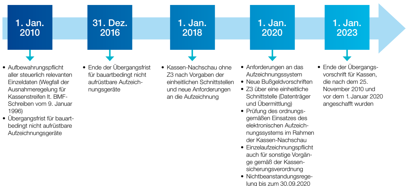
Abb. 4: Zeitliche Abfolge des Inkrafttretens der neuen Vorschriften

PKF stellt Erfahrungen aus kassenbezogenen Projekten und Branchen-/IT-Experten für die rechtssichere integrierte Lösung typischer Fragestellungen im Kassenumfeld sowie für die vollständige Planung und Umsetzung von Kassenprojekten zur Verfügung.